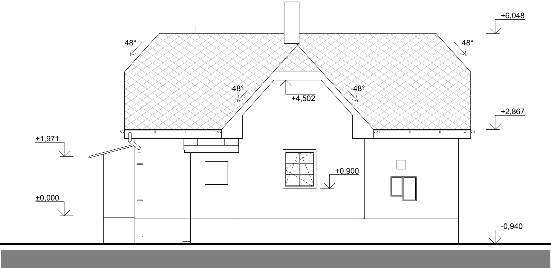
Pohled z jihovýchodu